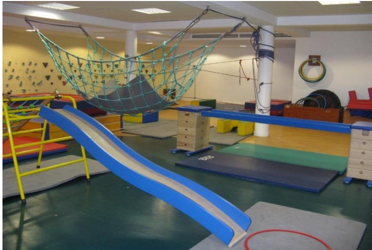
Salle de sport